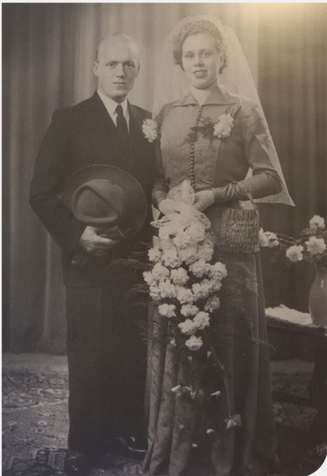
↗ De trouwfoto.

Ze woont alweer een jaar of vijf binnen de muren van Huize Winterdijk. Eind 2018 nam ze haar intrek in kamer 55. Haar dochter vertelt toen haar vader overleed, moeder verhuisde naar een appartement in Gouda. “In de tunnelflat vond ze toen een mooie plek. Gaandeweg nam haar geheugenfunctie af. Ze was al een paar keer gebeld toen er hier een plekje was, maar ze hield de boot af. Later gaf ze toe dat ze eigenlijk eerder had moeten verhuizen. Ze merkte zelf ook dat het zelfstandig wonen bijna niet meer ging.” Sinds zo’n anderhalf jaar woont ze op afdeling Het Bakken. Daar krijgt ze volledige zorg en begeleiding.