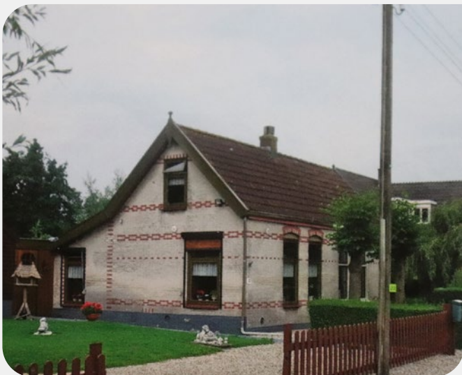
➤ Het voormalige ouderlijk huis aan de Vlietdijk

Het is goed om deze momenten met moeder te koesteren. Het kan zo maar de laatste keer zijn.