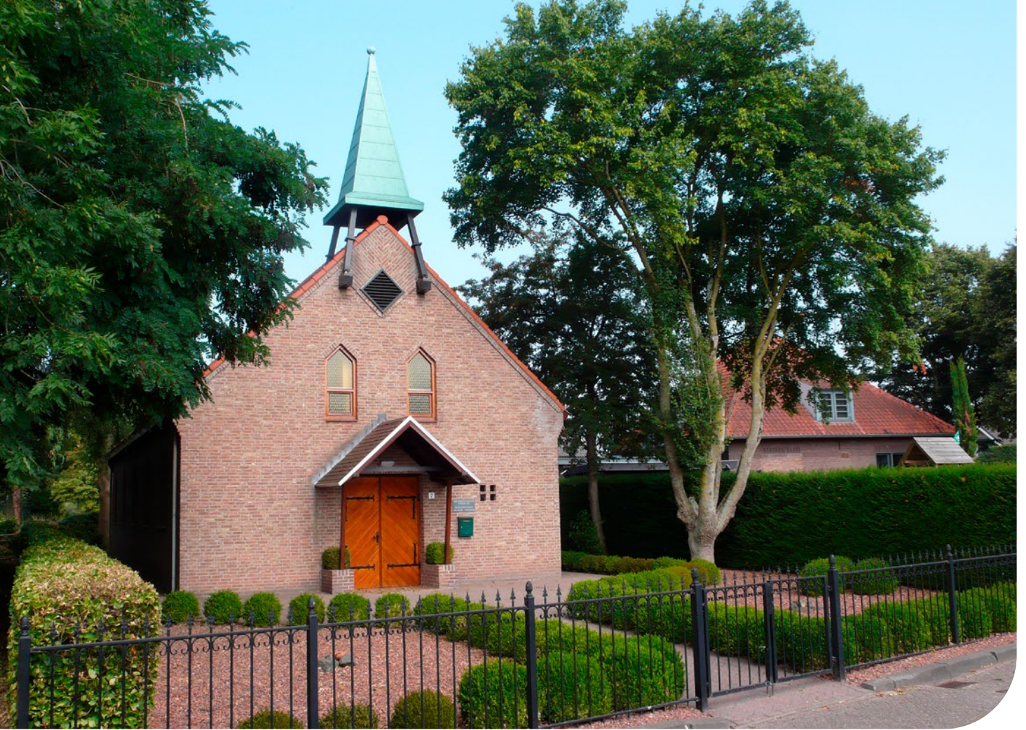
➤ Kerkgebouw van de GGin te Sprang Capelle

het de bedoeling is dat het leven Gods in de ziel verhongert, dat er een afkeer wordt gewekt tegen geestelijk voedsel, tegen het Woord Gods, tegen heilige overdenking en tegen gemeenschapsoefening met God. Bid tegen zondige wereldgelijkvormigheid in alles, opdat de Heilige Geest niet bedroefd, Christus niet onteerd en opnieuw door u gekruisigd zou worden. Het is te vrezen dat veel van het hedendaagse christendom graag schikkingen treft met de wereld. De gezindheid die zeer velen kenmerkt, is: Wat zult gij mij geven, en ik zal Hem u overleveren? is een verraden van Christus aan de wereld, een verkopen van het christendom voor haar goede dunk, haar ereplaatsen, haar invloed en gewin. De wereld, het vlees en de satan zijn erop uit om een christen zijn godsdienst af te kopen. Wat zult gij mij geven? is de gretige vraag van velen. O, ontzettende toestand! O, schrikkelijker bedrog! O, gruwelijke zelfmisleiding!