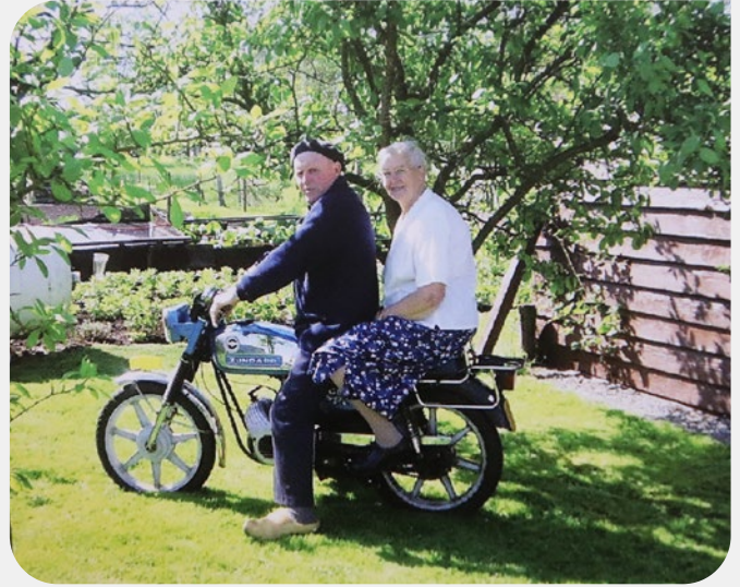
↗ Zo waren ze in Reeuwijk bekend. Samen reden ze op de brommer.